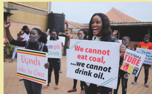
Klimaatstaking met Vanessa Nakate, Kampala, Uganda 2020