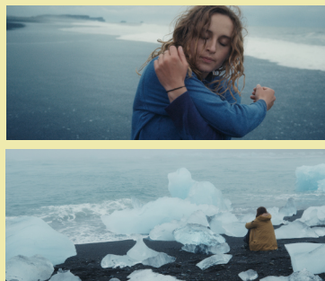
Camille Étienne - Pour un soulèvement écologique Stills © Solal Moisan Echo Studio 2023.

Door het maken van films, het optreden in talkshows en daarnaast zeer actief en zichtbaar te participeren in diverse klimaatacties – en niet te vergeten haar grote schare volgers op de diverse social media – groeide ze de afgelopen jaren uit tot de Franse evenknie van Greta Thunberg.